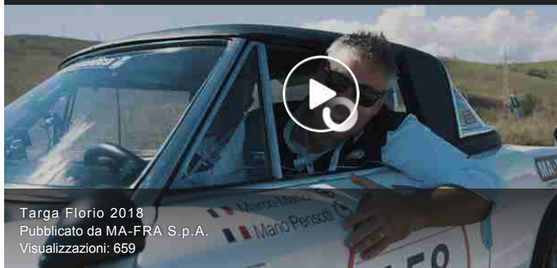
Targa Florio 2018 Pubblicato da MA-FRA S.p.A. Visualizzazioni: 659

Sembra che tu stia riscontrando problemi con la riproduzione di questo video. In caso affermativo, prova a riavviare il browser. Chiudi