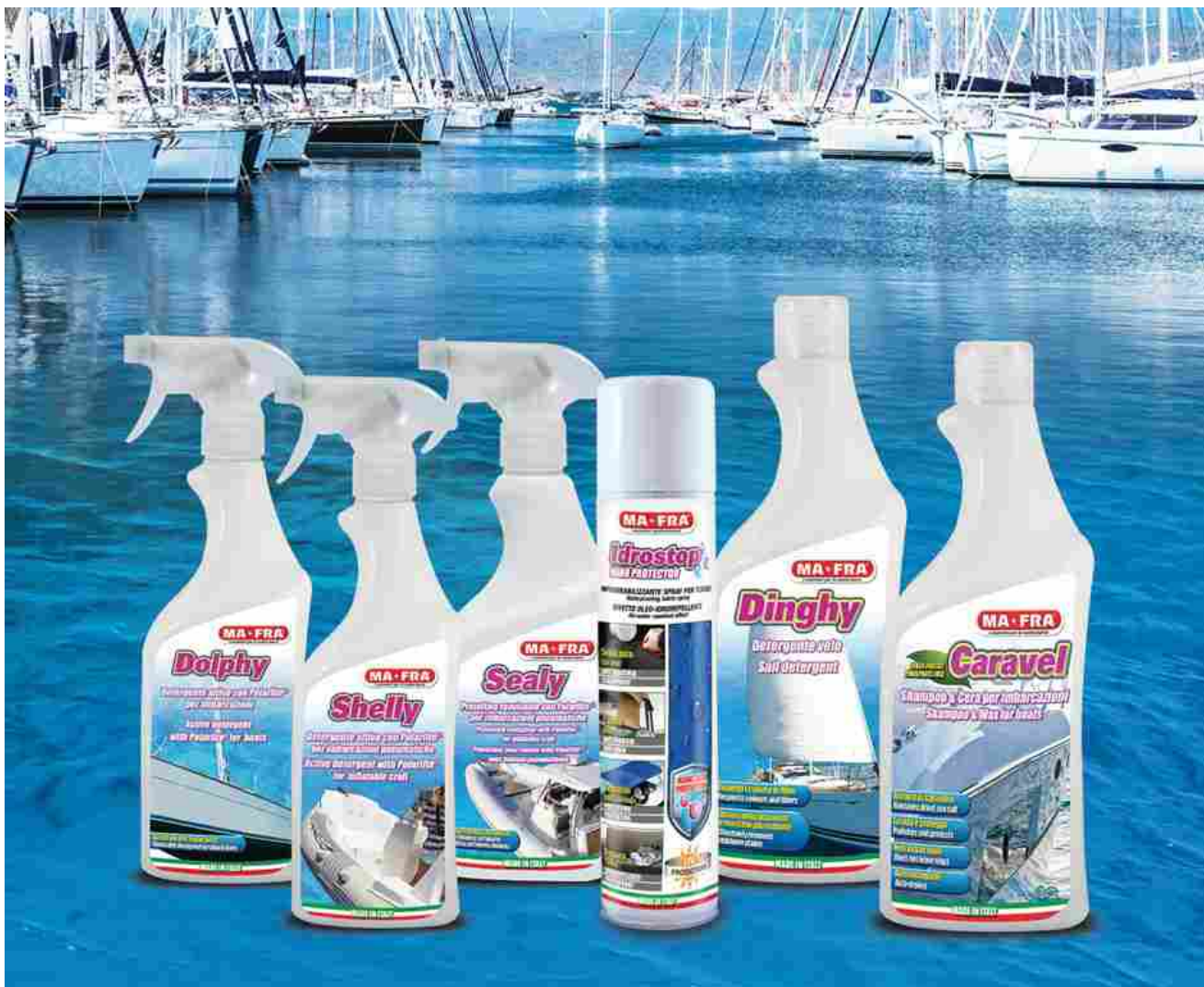
MAFRA Boat Care Line

MAFRA, azienda italiana con oltre 50 anni di esperienza nello sviluppo e nella produzione di soluzioni dedicate alla detergenza per il settore automotive, in occasione del Marine Equipment Trade Show 2018 di Amsterdam espone "Boat Care Line", la propria gamma specifica per il settore nautico. Si tratta di un'offerta completa e di elevata qualità per la detergenza e la manutenzione delle differenti tipologie di imbarcazioni, recentemente implementata con formulazioni rinnovate, caratterizzate da polimeri e protettivi di ultima generazione, per trattamenti ancora più efficaci, e prodotti del tutto nuovi.