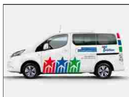
PROGRESS È A FIANCO DI