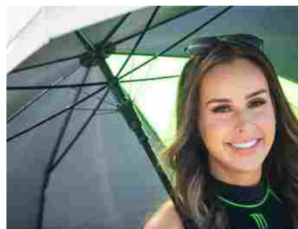
Paddock Girls SBK Thailandia 2019

Prodotti pulizia auto: arriva la bella stagione e cosa c'è di meglio di una vettura bella e splendente? Certo, chi non ha tempo può andare all'autolavaggio. Ma vogliamo mettere la soddisfazione di mettere la cera, e togliere la cera? Roba da Karate Kid, l'avete già intuito. Siccome siamo attenti ai nostri lettori, abbiamo deciso di fare una piccola lista dei prodotti per la pulizia dell'automobile che ci convincono di più. Come sempre, potete segnalare i vostri consigli nei commenti, oppure scrivere la vostra piccola