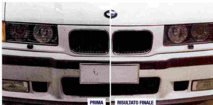
Sopra, un esempio di decontaminazione meccanica eseguita con il Kit MaFra Regénera Carrozzeria: la differenza tra la parte trattata e quella non trattata della vettura è evidente.