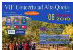
Domenica sarà Concerto ad alta quota