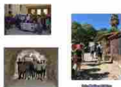
Erasmus+ tra Arte e Scienza