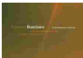
"Torneremo ancora", il nuovo album di Franco Battiato