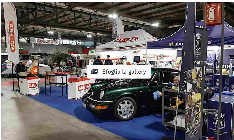
MAFRA A MILANO AUTOCLASSICA 2019

Lo stand di Mafra a Milano AutoClassica 2019 è una tappa obbligata per cultori della cura dell'auto e del car detailing. Nell'area espositiva allestita dall'azienda all'interno del padiglione 22 si trovano prodotti e indicazioni indispensabili per conservare al meglio e per valorizzare tutte le vetture, anche quelle youngtimer e d'epoca, facendole brillare come nuove.