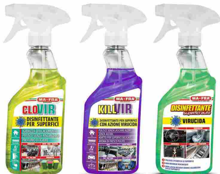
Killvir, Clovir e Disinfettante Superfici Auto di Mafra

I prodotti MAFRA che hanno ricevuto l'autorizzazione da parte del Ministero della Salute come biocidi disinfettanti con azione virucida sono Killvir, Clovir e Disinfettante Superfici Auto ideali se si vuole realizzare una disinfezione.