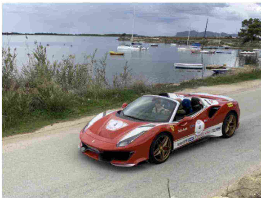
La mitica Ferrari sarà presente alla Targa Florio

Oltre all'Italia che conta il maggior numero di presenze, si contano equipaggi in arrivo da Arabia Saudita, Austria, Belgio, Canada, Francia, Germania, Giappone, Gran Bretagna, Grecia, Messico, Olanda, Polonia, Spagna, Stati Uniti, Svezia, Svizzera e Ucraina.